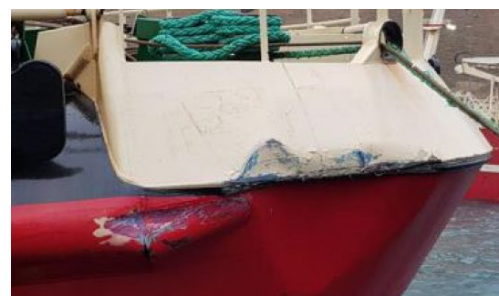
Ákoman á Nordborg og stefni Vestmannaeyjar