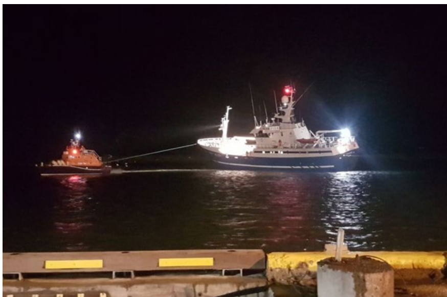
Mynd 2 Björgunarskipið Björg togar í Tjald

Við skoðun kafara, eftir að skipið náðist á flot, komu engar skemmdir í ljós.