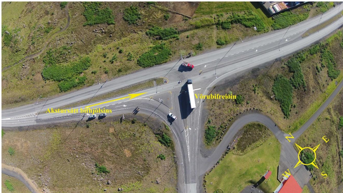
Mynd 2: Loftmynd af vegamótunum skömmu eftir slysið.