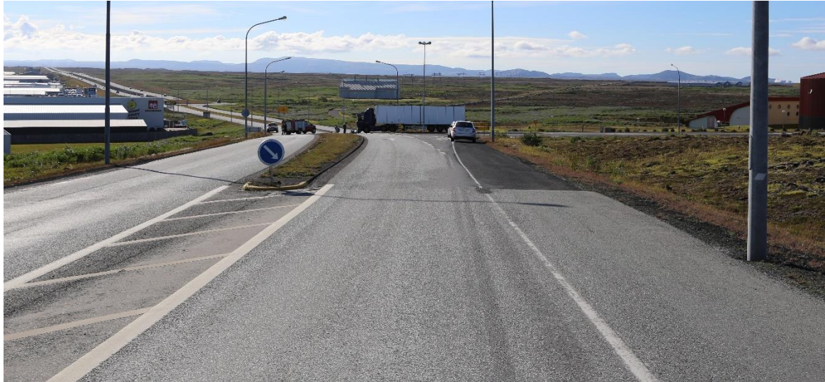
Mynd 1: Mynd af vettvangi tekin í akstursátt bifhjólsins (austur).

Snemma morguns hinn 7. júlí 2016 var bifhjóli ekið austur Reykjanesbraut. Veður var gott, lítil vindur, þurrt og bjart. Rétt áður en bifhjólið kom að vegamótum við Hafnaveg var Scania vörubifreið með festivagn ekið inn á Reykjanesbrautina í vinstri beygju í veg fyrir hjólið. Ökumaður bifhjólsins hemlaði þannig að a.m.k. annað hjólið læstist og lenti bifhjólið harkalega á vinstri hlið vörubifreiðarinnar. Lést bifhjólamaðurinn samstundis. Einn farþegi var í vörubifreiðinni auk ökumanns.