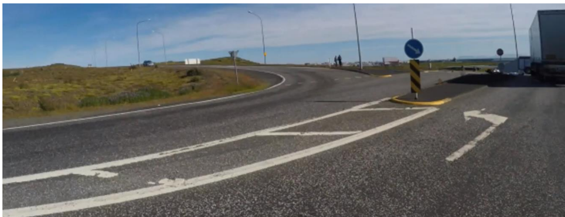
Mynd 3: Reykjanesbraut liggur upp hæð vestan við vegamótin og útsýn því takmörkuð.