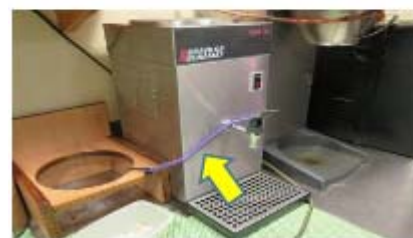
Teygjufesting að framan