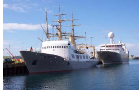
Bjarni Sæmundsson

Skipaskr.nr. 1131 Smíðaður: Bremenhaven Þýskalandi 1970, stál Stærð: 776,6 brl. 822 bt. Mesta lengd: 55,88 m Skráð lengd: 50,26 m Breidd: 10,6 m Dýpt: 7 m Vél: MAN 1326 kW, 2005 Fjöldi skipverja: 20