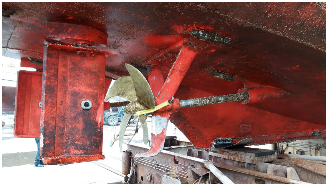
Mynd 2 Stýri, skrúfa, öxull og upphengja stjórnborðsmegin

Leki hafði komið með áspétti á stjórnborðsöxli en það tókst að þétta hann með því að herða á því. Engan annan leka var að finna, engin mengun, stýri virkaði og einnig dýptarmælar.