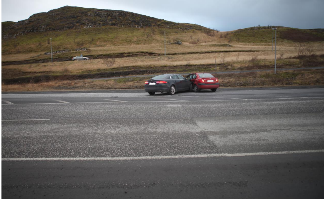
Mynd 3: Mynd frá lögreglu tekin frá vegöxlinni þar sem ökumaður Kia bifreiðarinnar hafði stöðvað fyrir áreksturinn. Myndin en tekin í átt að Lágafelli og sýnir hvar bifreiðarnar stöðvuðust eftir áreksturinn.

Á vettvangi eru þrjár akreinar, tvær fyrir umferð á leið til Reykjavíkur og ein fyrir umferð í gagnstæða átt. Skammt austan við árekstrarstað er umferðareyja og í framhaldi af henni er merkt bannsvæði með óbrotnum línunum þar sem ekki er gert ráð fyrir umferð ökutækja. Bannsvæðið nær um 75 metra út frá umferðareyjunni. Í framhaldi af bannsvæðinu er tvöföld óbrotin lína milli akstursátta.