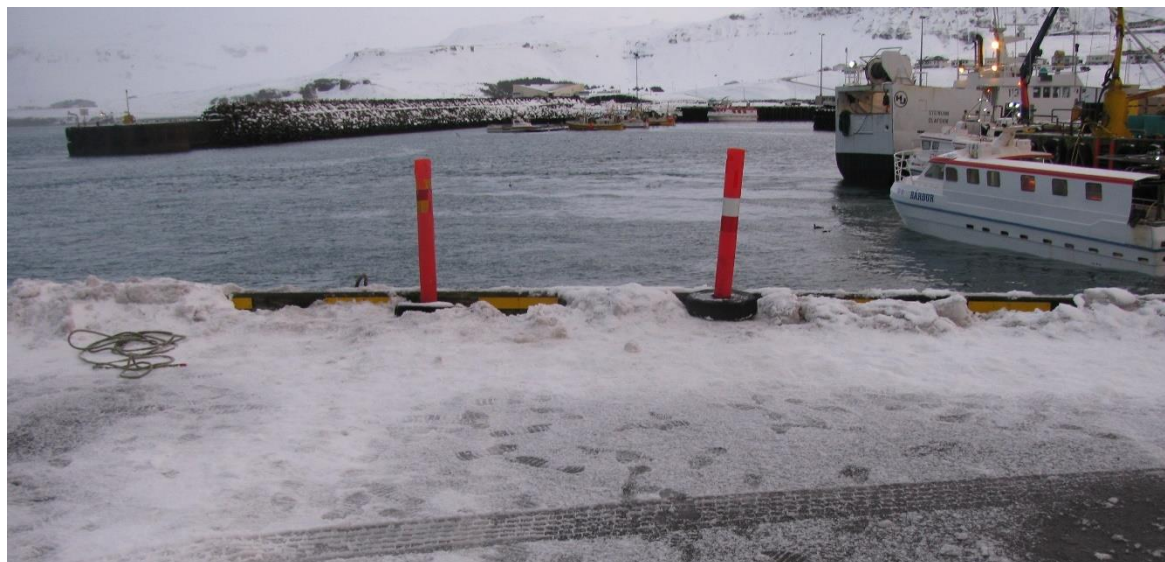
Mynd 2: Mynd af bryggjukantinum. Sjá má snjóruðning sem myndar leið upp á kantinn.

Snjór hafði þjappast saman við 22 cm háan kantinn og dregið úr varnargildi hans. Snjórinn var harður og gaf ekki eftir þegar bifreiðinni var ekið yfir hann. Því hafnaði hún í sjónum. Bifreiðin fór öll á kaf svo rétt mátti greina hana ofan af hafnarbakkanum. Slysið var tilkynnt klukkan 16:40 og 18 mínútum síðar var búið að ná ökumanninum í land og endurlífgun hafin. Endurlífgun bar ekki árangur. Dánarorsök var drukknun. Var ökumaðurinn sennilega spenntur í öryggisbelti.