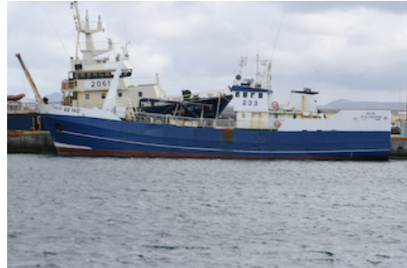
Erling © Guðmundur St. Valdimarsson . LHG