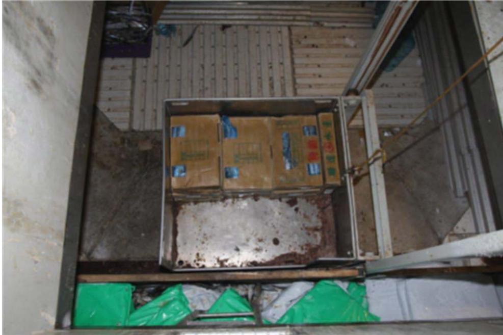
Mynd 1, sýnir ofan á lyftuna og fallhæð