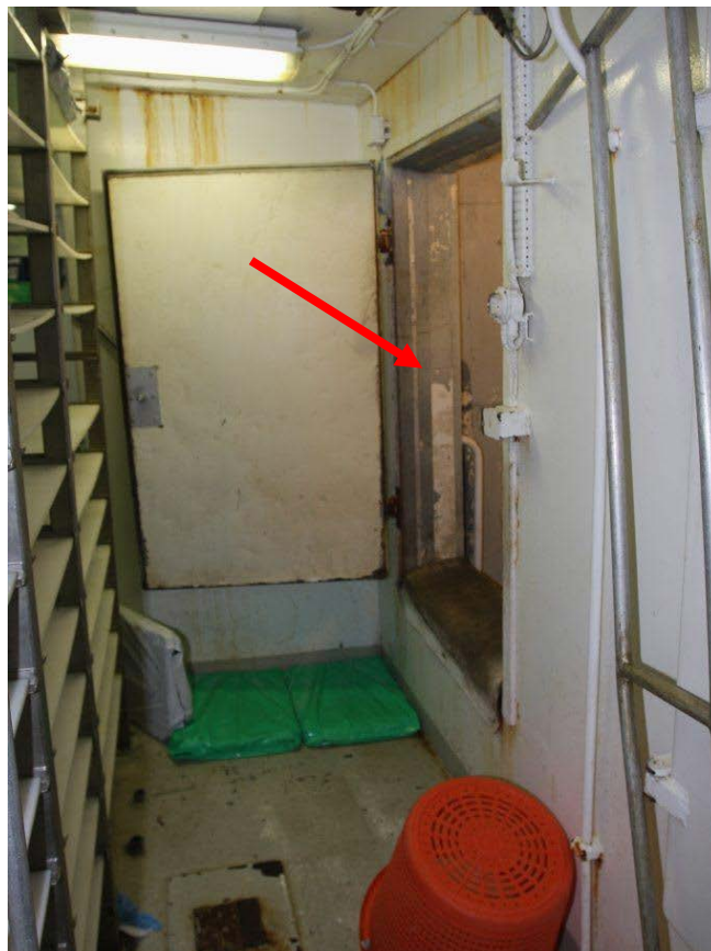
Mynd 2 er tekin á millipilfari, örin sýnir opið niður í lest