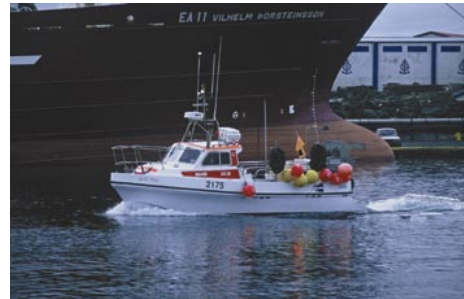
Eyjólfur Ólafsson©Jón Sigurðsson

Skipaskr.nr. 2175 Smíðaður: Hafnarfirði 1992, plast Stærð: 7 brl. 7,7 bt. Mesta lengd: 9,0 m Skráð lengd: 8,98 m Breidd: 3,08 m Dýpt: 1,4 m Vél: Cummins 1997, 187 kW Fjöldi skipverja: 1