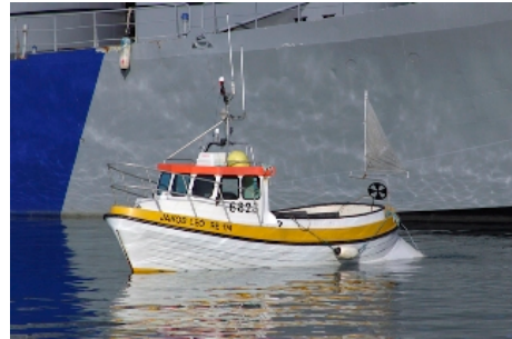
Jakob Leó

Skipaskr.nr. 6823 Smíðaður: Hafnarfirði 1986 plast Stærð: 5,8 brl. 5,1 bt. Mesta lengd: 7,99 m Skráð lengd: 7,9 m Breidd: 2,62 m Dýpt: 1,47 m Vél: Nanni 53 kW 1987 Fjöldi skipverja: 2