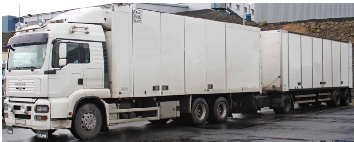
Mynd af vörubifreiðinni með tengivagninn. Alls mældist vagnlestin 22,7 metrar að lengd.

Jeppabifreiðin var tekin til skoðunar af bifreiðasérfræðingi eftir slysið. Ekkert kom fram í þeirri skoðun sem talið er geta haft áhrif á orsök þessa slyss.