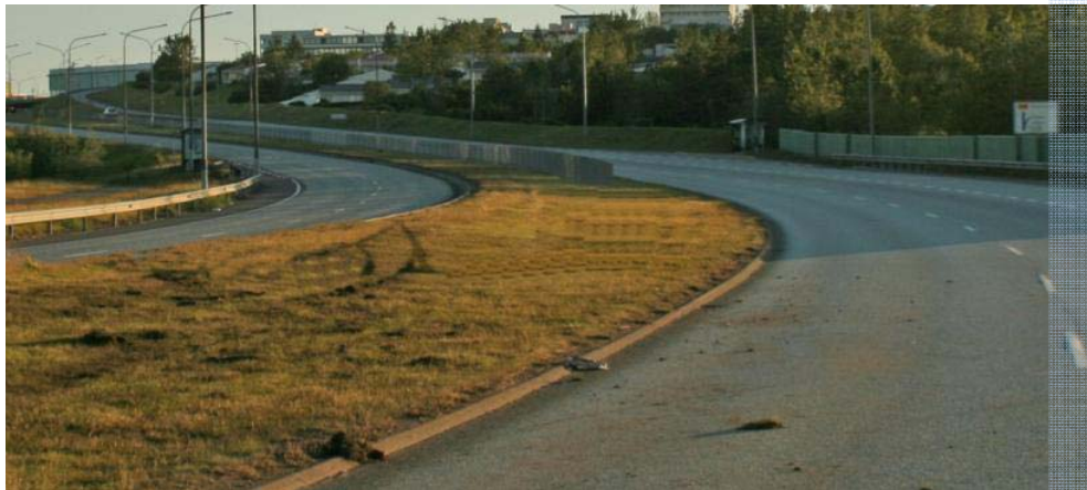
Mynd tekin á vettvangi til norðurs (á móti akstursátt). Sjá má för eftir bifreina á miðeyjunni.

Ökumaður lítillar fólksbifreiðar ók suður Hafnarfjarðarveg að nóttu til. Í bifreiðinni, auk ökumanns, voru fimm farþegar. Farþegar og ökumaður voru allt ungmenni undir tvítugu. Var bifreiðinni ekið á vinstri akrein niður brekku sem endar í aflíðandi hægri beygju. Neðarlega í brekkunni missti ökumaður stjórn á bifreiðinni. Af ummerkjum, á vettvangi að dæma, var bifreiðinni ekið utan í kantstein við miðeyju vegarins. Ökumaður missti við það vald á henni, ók upp á miðeyjuna og þar snerist bifreiðin og valt tvær veltur. Bifreiðin endaði á hjólunum á norðurakrein Hafnarfjarðarvegar rúnum 60 metrum frá þeim stað þar sem hún fór upp á miðeyjuna. Ökumaðurinn var 18 ára og hafði haft réttindi til aksturs í innan við ár.