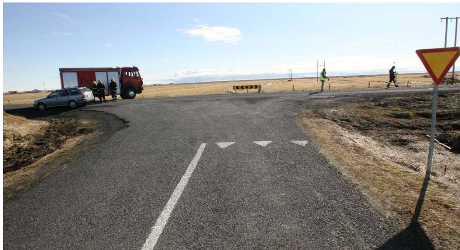
Mynd 2. Biðskylda á Kaldaðarnesvegi.

Slysið varð að morgni til, skömmu fyrir hádegi. Sól var hátt á lofti og veður stillt og bjart. Aðstæður til aksturs voru góðar, báðir vegir með bundnu slitlagi, þurrir og auðir. Biðskylda er á Kaldaðarnesvegi gagnvart umferð á Eyrabakkavegi og skilti til merkis um það auk yfirborðsmerkinga (sjá mynd 2).