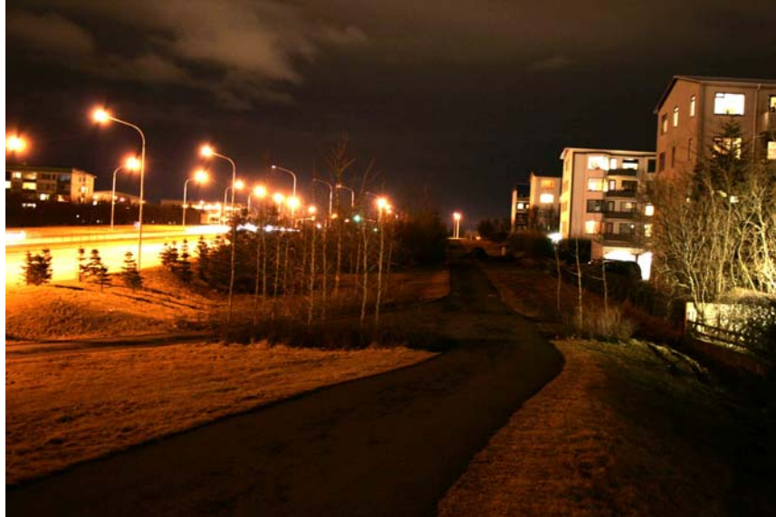
Mynd tekin sunnan megin Miklubrautar austur göngustíg sem liggur að gatnamótum við Háaleitisbraut. Myndin er tekin að næturlagi í dimmu.

Niðurstöður áfengisprófs ökumanns bifreiðarinnar voru neikvæðar.