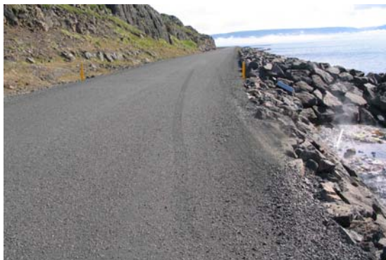
Mynd tekin frá þeim stað sem maðurinn lá í átt frá þar sem bílinn kom frá. Á myndinni sjást hemluför eftir bifreiðina.

Slysið átti sér stað um miðjan daginn. Fólk á tveimur bílum var á ferðalagi um Vestfirði, nánar tiltekið á Drangsnisvegi í áttina til Hólmavíkur. Í austanverðri Hveravík liggur vegurinn niður við fjöru og eru minjar gamallar sundlaugar í flæðarmálinu. Hafði fólkíð stöðvað bifreiðarnar þar og lagt þeim við vegbrún fjær fjörunni (sjá myndir hér að neðan). Í þann mund ók Nissan fólksbifreið inn í víkina einnig áleiðis til Hólmavíkur. Ökumaður fólksbifreiðarinnar hægði á sér er hann tók eftir bílunum sem lagt hafði verið á hægri akrein miðað við akstursstefnu hans.