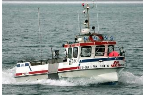
Bogga í Vík

Skipaskr.nr. 6780 Smíðaður: Hafnarfirði 1980 plast Stærð: 7,5 brl. 6,5 bt. Mesta lengd: 9,14 m Skráð lengd: 9,12 m Breidd: 2,53 m Dýpt: 1,72 m Vél: Yanmar 257 kW, 2002 Fjöldi skipverja: 1