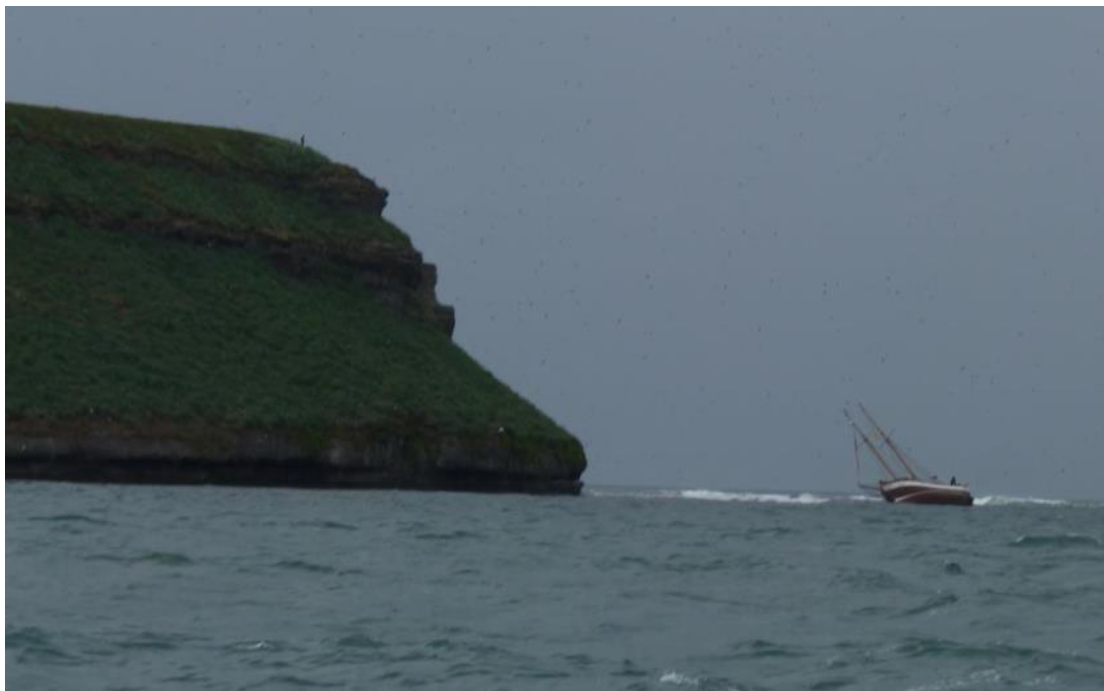
Haukur á strandstað við Lundey

undirbjuggu farþegana til að yfirgefa skipið og gekk það síðan áfallalaust eftir að aðrir bátar komu á strandstað.