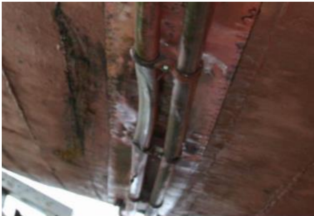
Skemmdir á utanborðskæliröri

Um kl. 21:00 tókst að losa skipið af strandstað og var því siglt til Húsavíkur þar sem það var tekið á land. Í ljós komu minniháttar skemmdir s.s. rispur, að tróð losnaði á einum stað og utan á liggjandi kælir fyrir aðalvél dældaðist.