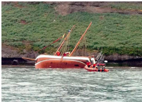
Haukur á strandstað

Siglt var frá Húsavík og stefna tekin vestan og síðan norðan Lundeyjar en þegar komið var austur af miðri eyjunni var stöðvað u.þ.b. 150-200 m frá eyjunni til að sýna farþegum fuglalíf. Skipstjóri lagði skipið þannig til að hann bakkaði á hægustu ferð upp í vindinn svo það sneri stefni til eyjarinnar á meðan farþegar tóku myndir.