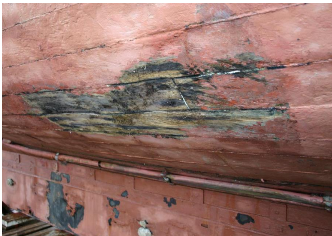
Skemmdir (rispur) á bol og hluti skemmda á kælröri

Kafari var fenginn á staðinn til að kanna skemmdir og aðstæður neðansjávar áður en skipið var dregið á flot. Hans mat var að best væri að draga það til norðausturs.